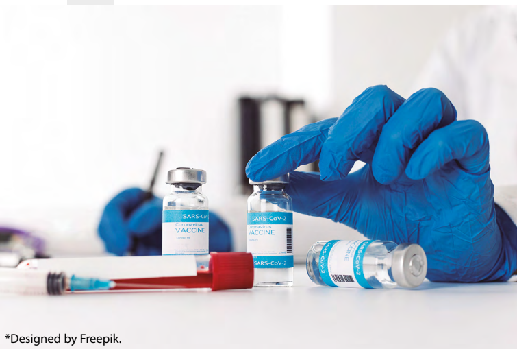
*Designed by Freepik.

Además, hay otras alternativas complementarias para regular la inmunogenicidad de los péptidos generados o que estos ARNm sean más fácilmente reconocidos por receptores reconocedores de patrones como RIG-I, PKR o TLR3, TLR 7 y TLR 8. Así serán internalizados en las células presentadoras de antígenos para su traducción posterior en un contexto claramente coestimulador y activado de la inmunidad. Una de ellas es el uso de pseudouridina (Y) es un isómero del nucleósido uridina (U) muy prevalente en los ARNr, los ARNt y los snRNA y es la modificación más abundante en el ARN celular total, lo que la convierte en el quinto nucleótido del ARN. La incorporación de nucleósidos químicamente modificados, como pseudouridina, 1-metilpseudouridina, 5-metilcitidina y otros en el ARNm, generalmente mejora la traducción al